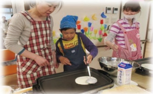
ホットプレートでクレープ生地を焼きます