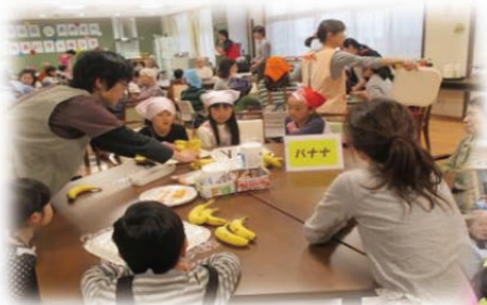
テーブルごとに分かれトッピングになるフルーツや野菜、ハムなどをカットします

平成28年5月7日（土）第3溪山荘あおぞら第2回地域交流イベントを開催しました。 今回は、『ふれあいクッキング』と題しましてクレープ作りを行いました。 今回もまた地域の方々がたくさん参加してくださいました。 前回は上回り総勢70名の大盛況のイベントとなりました。 ありがとうございます！