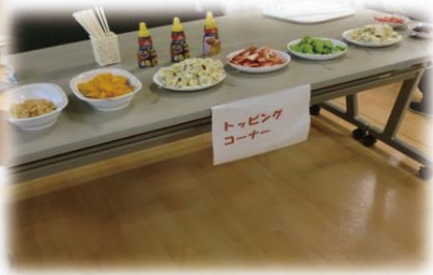
そして、出来上がったトッピング