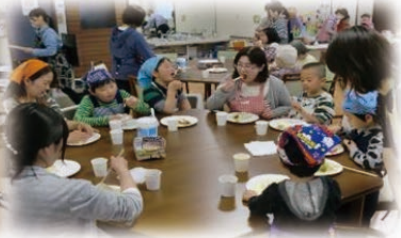
自分の好きなトッピングで自分だけのオリジナルクレープを楽しみました